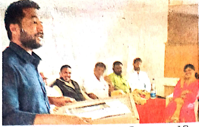
कळंब तालुक्यातील शिराढोण येथील शरदचंद्र महाविद्यालयात काव्य मैफील पार पडली. यात सहभागी झालेले कवी.